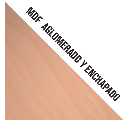
MDF AGLOMERADO Y ENCHAPADO